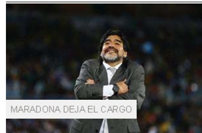
MARADONA DEJA EL CARGO