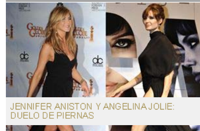
JENNIFER ANISTON Y ANGELINA JOLIE: DUELO DE PIERNAS